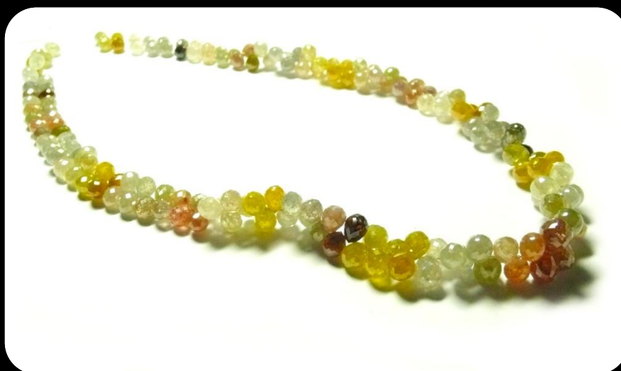
Collier diamant briolette multicolore