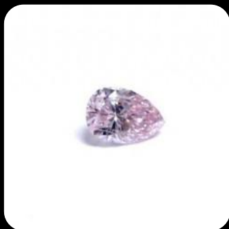
Diamant poire fancy intense purplish pink

Echelle de classification proposée par la société Argyle Diamonds