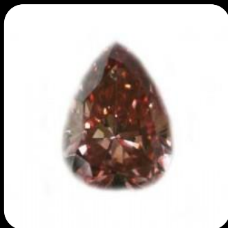
Diamant poire Fancy deep brownish pink

Optez pour une couleur qui vous correspond, une saturation faible ou prononcée selon votre personnalité, tous ces critères d'achats vous sont personnels. Vous recherchez un diamant de couleur rose, mais votre budget ne vous permet pas d'acquérir un diamant rose pure, porter votre attention sur les diamants de couleur rose-brun ou brun-rosé, les prix sont plus abordables.